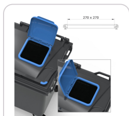
SURCOUVERCLE (LIL) CARRÉ 2/4R