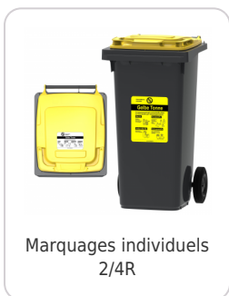
Marquages individuels 2/4R