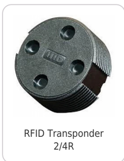
RFID Transponder 2/4R