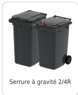
Serrure à gravité 2/4R