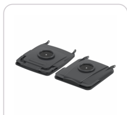
Opercule verre 152 2R CL SL