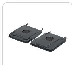
Opercule verre 152 élastomère 2R CL SL