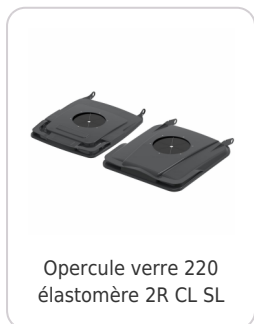
Opercule verre 220 élastomère 2R CL SL