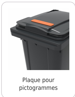
Plaque pour pictogrammes