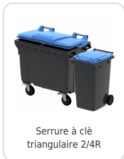
Serrure à clé triangulaire 2/4R