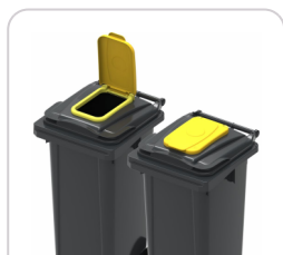
Surcouvercle rectangulaire 2R