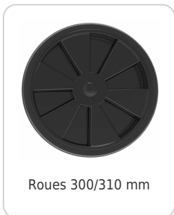
Roues 300/310 mm