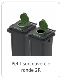
Petit surcouvercle ronde 2R