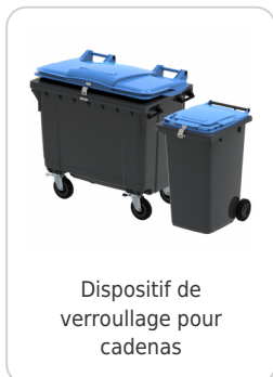
Dispositif de verrouillage pour cadenas