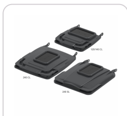
Opercule emballages 155x255 2R CL SL