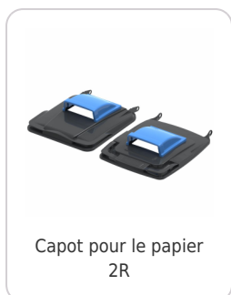
Capot pour le papier 2R