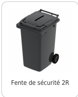
Fente de sécurité 2R