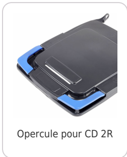
Opercule pour CD 2R